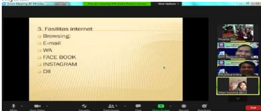
Gambar 2 Penyampaian Materi Oleh Tutor Tentang Fasilitas Internet

Setelah mengikuti pelatihan santri dapat meningkatkan kemampuan dan pengetahuannya dalam penggunaan internet untuk proses belajar mengajar, dapat menambah pengetahuan teknis serta keterampilan teknis dalam pemakaian teknologi informasi dan komunikasi serta mengetahui tingkat penggunaan dan pemakaian alat komputerisasi dalam proses pembelajaran.