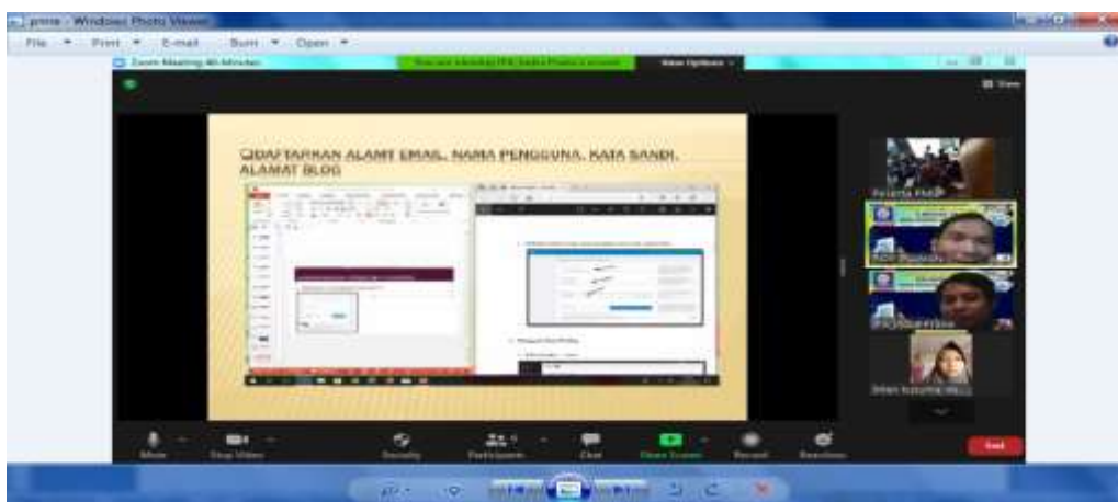
Gambar 3 Penyampaian materi oleh tutor tentang pembuatan blog