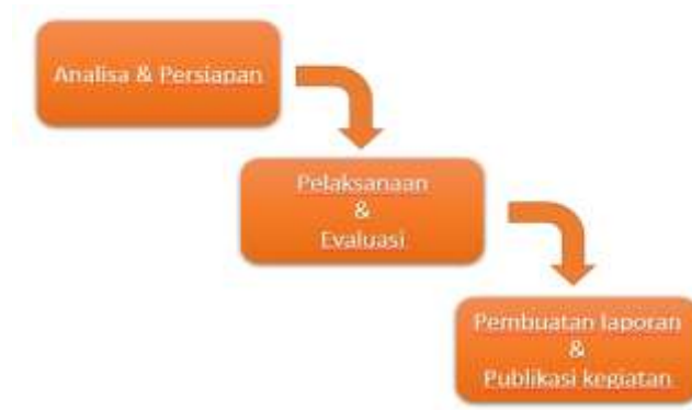
Gambar 1. Metode Pengabdian Masyarakat