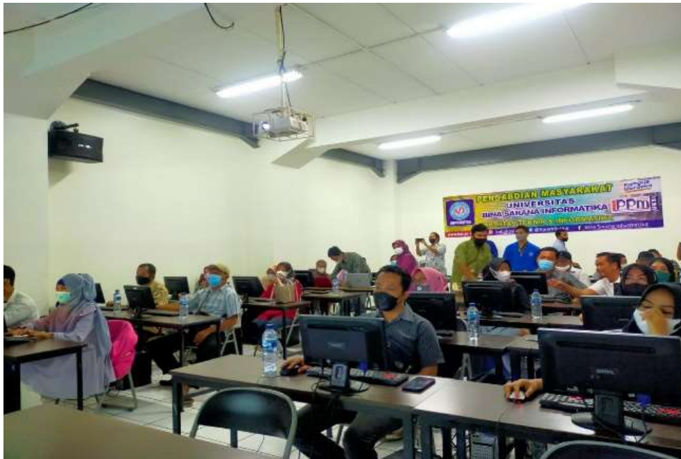
Gambar 6. Proses pelaksanaan pelatihan pada pengabdian masyarakat