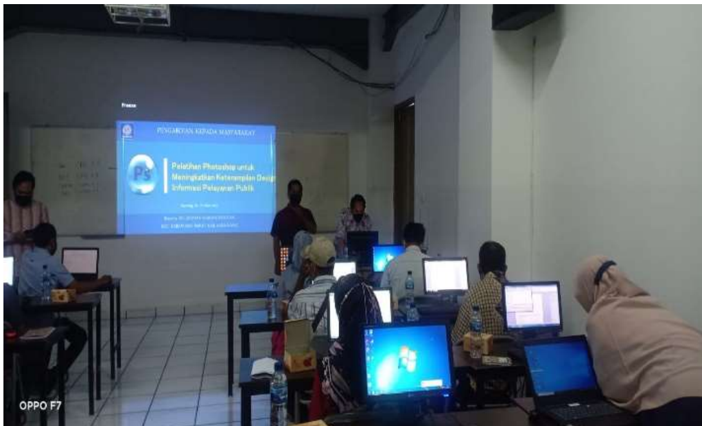
Gambar 5. Proses pelaksanaan pelatihan pada pengabdian masyarakat

Dari diagram pada gambar 2 merupakan hasil respon peserta pengabdian masyarakat yang di isi melalui kuesioner pada akhir kegiatan pada poin pertanyaan P7 yang di ketahui bahwa adanya kegiatan pengabdian masyarakat ini bermanfaat dan menambah wawasan serta keterampilan para warga dan staf kelurahan dalam membuat dan mendesain poster ataupun spanduk sebagai media informasi kepada warga di lingkungannya.