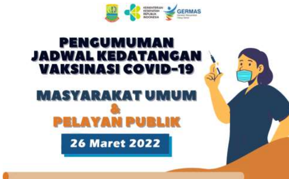
Gambar 3. Hasil desain peserta pengabdian masyarakat

Setelah melalui pelatihan photoshop yang dilaksanakan pada pengabdian masyarakat ini, para peserta sudah bisa mendesain poster pengumuman dengan hasil seperti gambar di bawah ini.