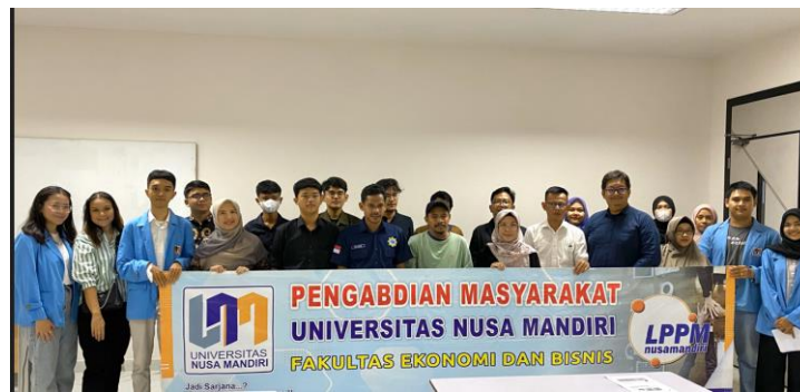
Gambar 3. Dokumentasi Pelaksanaan Kegiatan Pelatihan Cara Merintis Dan Memulai Suatu Bisnis Bagi Ikatan Remaja RW 07 Margonda

Kegiatan pengabdian kepada masyarakat berjalan lancar dan sangat baik sampai akhir serta mendapatkan tanggapan yang positif dari para peserta. Setelah penyampaian materi kegiatan, kegiatan pengabdian kepada masyarakat ini akan dievaluasi dengan cara memberikan kuesioner para peserta diberikan kuesioner untuk mengukur kemampuan peserta setelah pelaksanaan pelatihan. Kuesioner merupakan teknik pengumpulan data yang dilakukan dengan cara memberi seperangkat pertanyaan atau pernyataan tertulis kepada responden untuk dijawab (Sugiono, 2019).