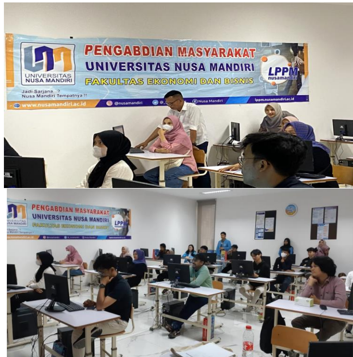
Gambar. 1 Dokumentasi Penyampaian Materi Kegiatan Pengabdian Kepada Masyarakat