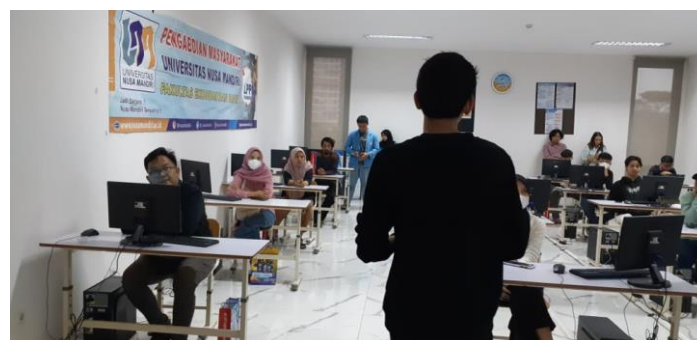
Gambar 2. Dokumentasi Penyampaian materi kegiatan dan tanya jawab serta diskusi

Gambar 2 menampilkan melanjutkan penyampaian materi kegiatan dan dilanjutkan tanya jawab serta diskusi serta diakhiri dengan foto bersama pada Gambar 3: